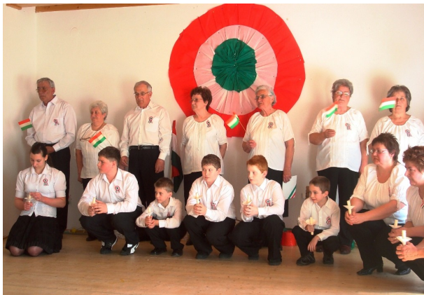
Az ünnepi műsor résztvevőinek egy csoportja

- Hát ilyen szép és megható ünnepi műsort nagyon régen láttam már – mondták többen szemükben könnycseppeket morzsolgatva a Kultúrházból távozóban. A helyi Dalkör és a falu ifjaiból verbuválódott csoport adott egy tényleg nagyon színvonalas műsort március 14-én közvetlenül a vasárnapi mise után az 1848-49-es forradalomra és a szabadságharcra valamint hőseire emlékezve.